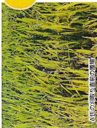
A氏の刈取り直前の圃場