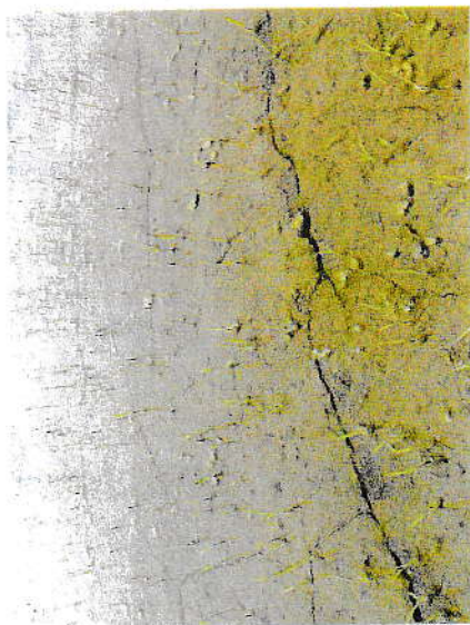
ヘリで潜水直播した田んぼでの苗立ちの様子。密度にはムラがあるが、生長につれてわけてわけてなくなる