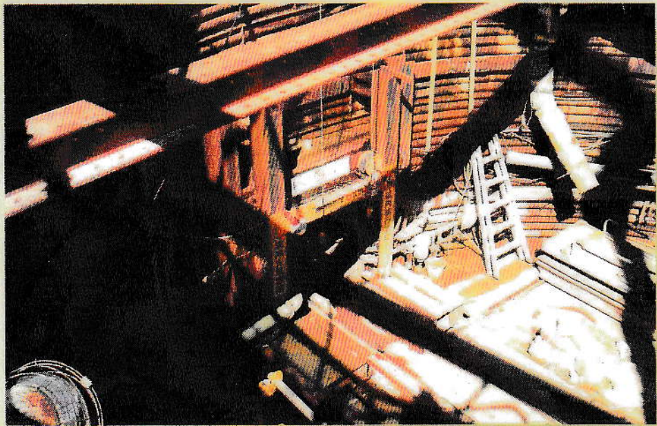
長野県営かんがい排水事業 (ミニシールド工法)

既設の基幹水利施設 (隧道) をミニシールド工により取り壊し、内径1,500mmのRCセグメントに置き換え補修した工事である。半機械掘りミニシールド工にて掘削された掘削外径とセグメント外径の空隙を5~10mmの豆砂利を圧縮空気で注入し、プレバックドコンクリート用混和剤を混入したセメントミルクを注入してプレバックドコンクリートを築造し、トンネル本体の防護と空隙を充填したものである。